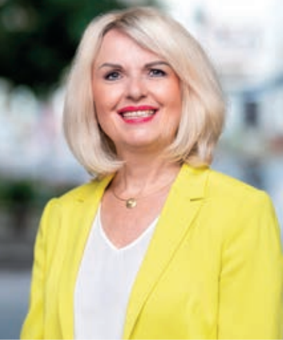
LANDRÄTIN TAMARA BISCHOF