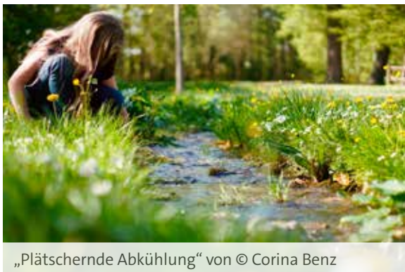
„Plätschernde Abkühlung“ von © Corina Benz