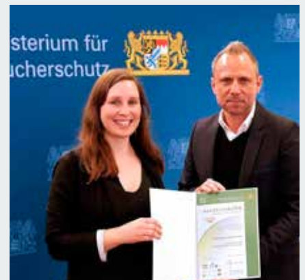
Die Umweltstation erhält die Auszeichnung Umweltbildung.Bayern für qualitativ hochwertige Bildungsarbeit.