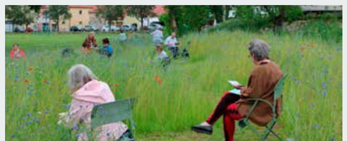
Teilnehmerinnen und Teilnehmer beim Workshop Aquarellmalerei in der Natur.