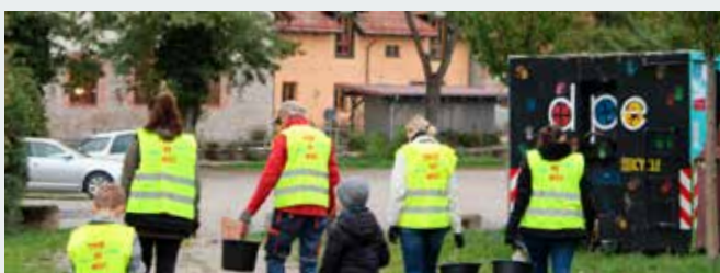
Die Umweltstation beteiligt sich an der Tour de Müll und den Aktionstagen „Zukunft durch Bildung“ mit einer Müllsammelaktion am Mainufer.