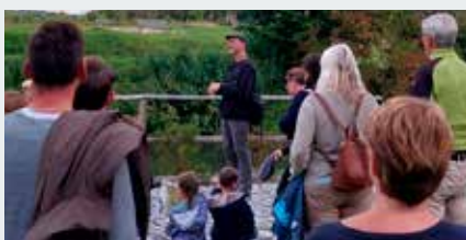
Europäische Fledermausnacht in der Umweltstation.