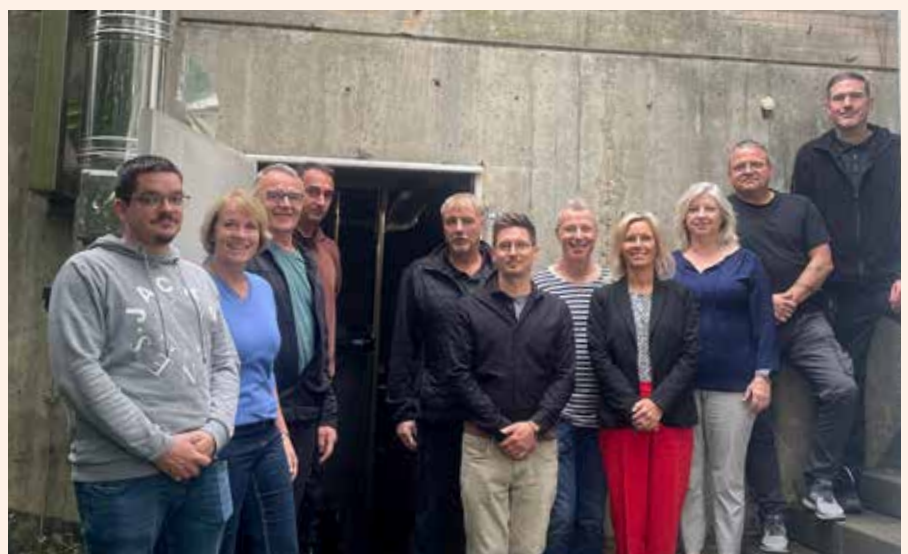
Teilnehmerinnen und Teilnehmer der Hausmeisterschulung 2025.