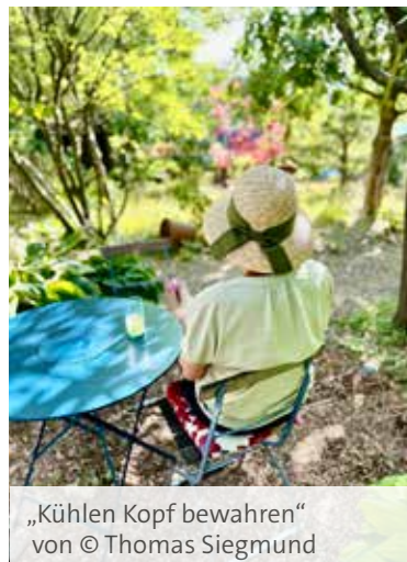
„Kühlen Kopf bewahren“ von © Thomas Siegmund