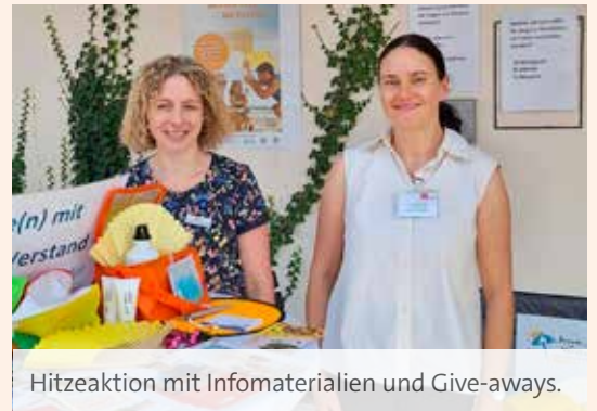
Hitzeaktion mit Infomaterialien und Give-aways.

Das Gesundheitsamt Kitzingen und die Gesundheitsregion plus Kitzingen setzen sich aktiv für den Schutz vor UV-Strahlen und Hitze einwirkung ein. Im August führten wir eine Präventionsaktion am Kitzinger Freibad aqua sole durch, um die Bevölkerung für Sonnenschutz und Hautkrebsprävention zu sensibilisieren. Ziel ist es, die Menschen, insbesondere Kinder und Jugendliche, über die Risiken intensiver Sonnenexposition aufzuklären und präventive Verhaltensweisen zu fördern.