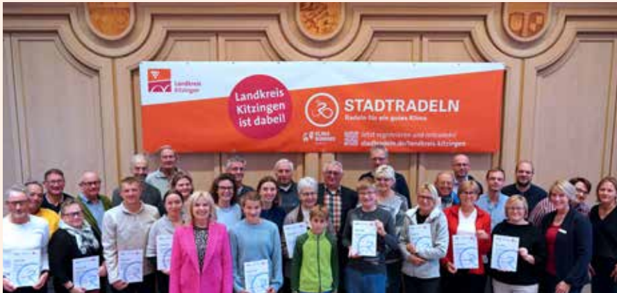
Die Preisträgerinnen und Preisträger des landkreisweiten STADTRADELN 2025.