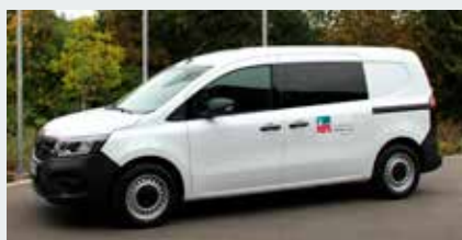
Neues Dienstfahrzeug – die Umweltstation Kitzinger Land fährt elektrisch!