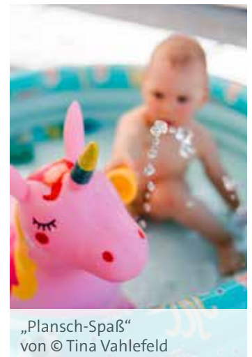
„Plansch-Spaß“ von © Tina Vahlefeld

Insgesamt waren über 70 Beiträge von rund 50 Fotografinnen und Fotografen eingereicht worden, die kühle Lieblingsorte in den Kategorien private Plätze und öffentliche Orte dokumentieren. Die eingereichten Fotos, die eine unabhängige Jury anonym ausgewählt hatte, spiegeln die Kreativität und die Verbundenheit der Teilnehmerinnen und Teilnehmer mit dem Kitzinger Land wider.